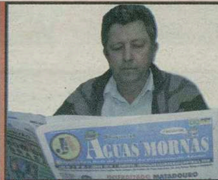
PRES. CRESOL (ISAIAS)