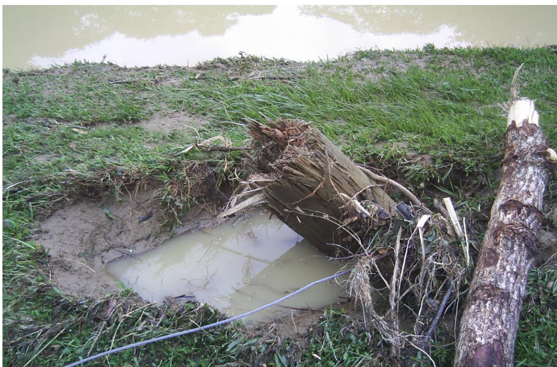
LOCALIDADE PICADAS – POSTE DA CELESC ARREBENTADO