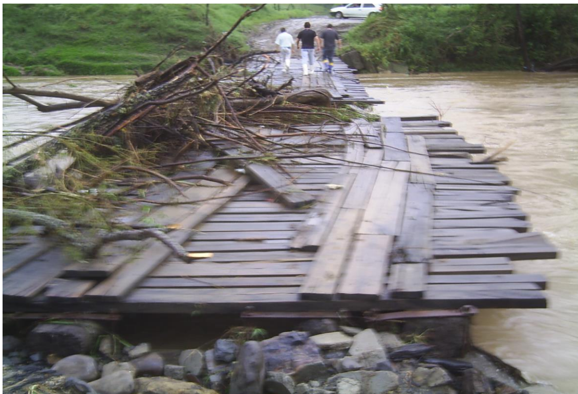
LOCALIDADE S. WENDOLINO – PONTE DANIFICADA - INTRANSITÁVEL