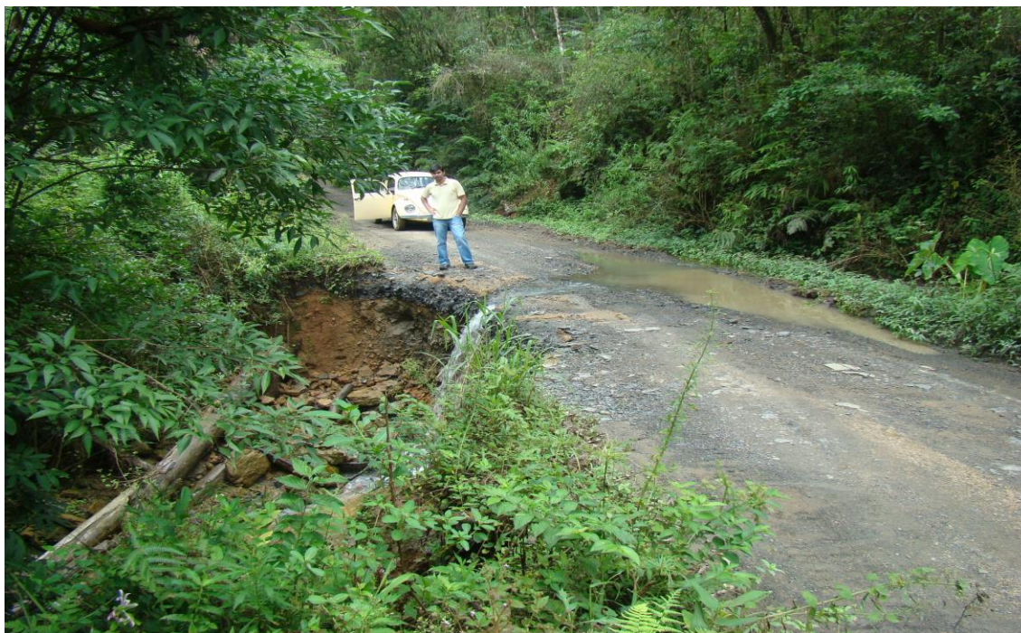
LOCALIDADE BARRO BRANCO – BUEIRO ENTUPIDO E EROSÃO NA ESTRADA