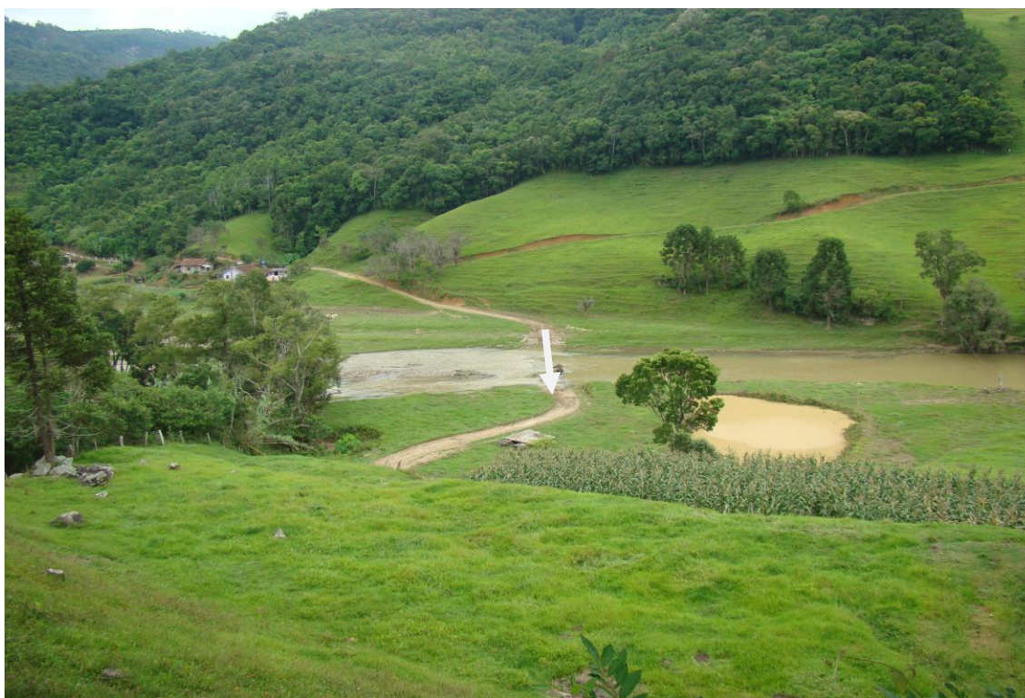
LOCALIDADE FURADINHO – PONTE DESAPARECIDA