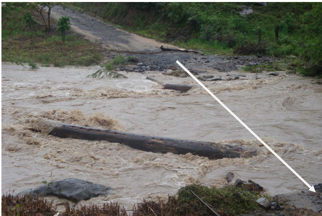
LOCALIDADE ÁGUAS FRIAS – LOCAL ONDE EXISTIA PONTE – MORADORES ISOLADOS