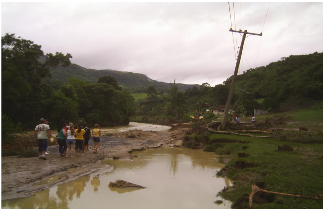
LOCALIDADE PICADAS – ESTRADA DANIFICADA