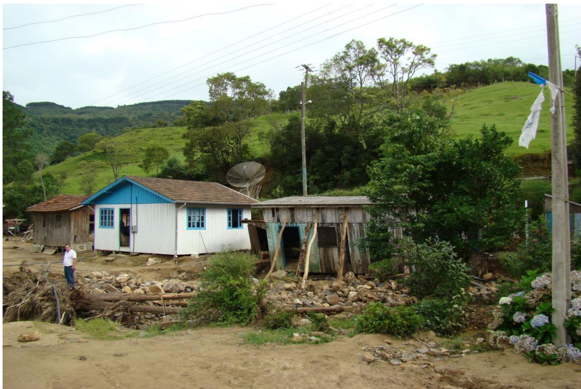
LOCALIDADE S. LEONARDO – CASAS ATINGIDAS