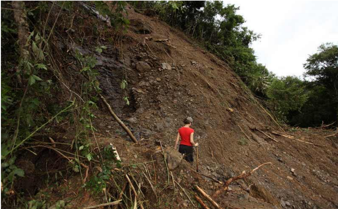
LOCALIDADE RIO DAS FURNAS - DESLIZAMENTO