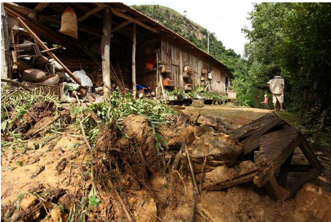
Localidade Rio das Furnas – Casa Sr. Dilmor Bell – deslizamento ao lado da casa