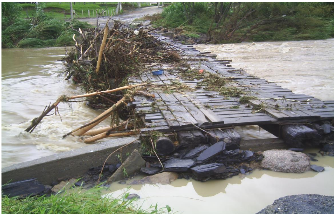
LOCALIDADE RIOZINHO – PONTE ACESSO RIOZINHO E PINGUIRITO