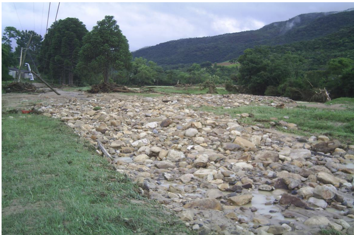
LOCALIDADE PICADAS – ESTRADA COBERTA DE PEDRAS E POSTES ARRANCADOS