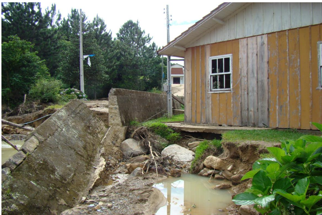
LOCALIDADE S. LEONARDO – CASA ATINGIDA