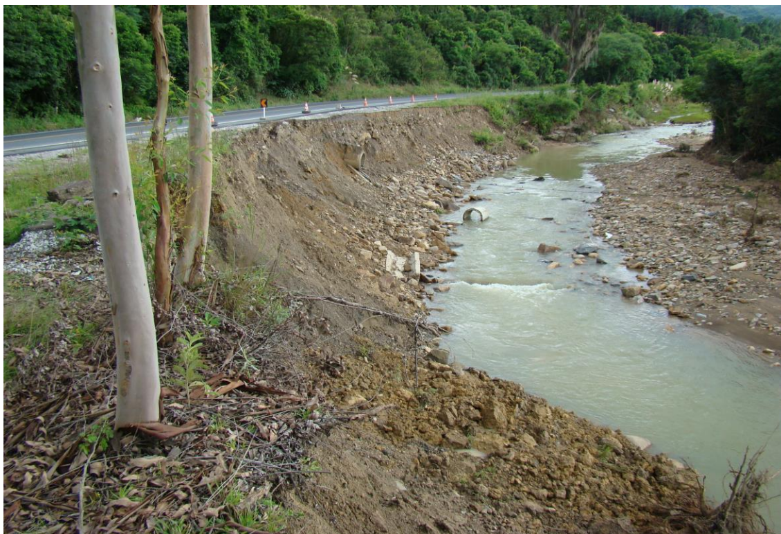
LOCALIDADE PICADAS BR 282 – DESLIZAMENTO CAUSADO PELA ENCHENTE