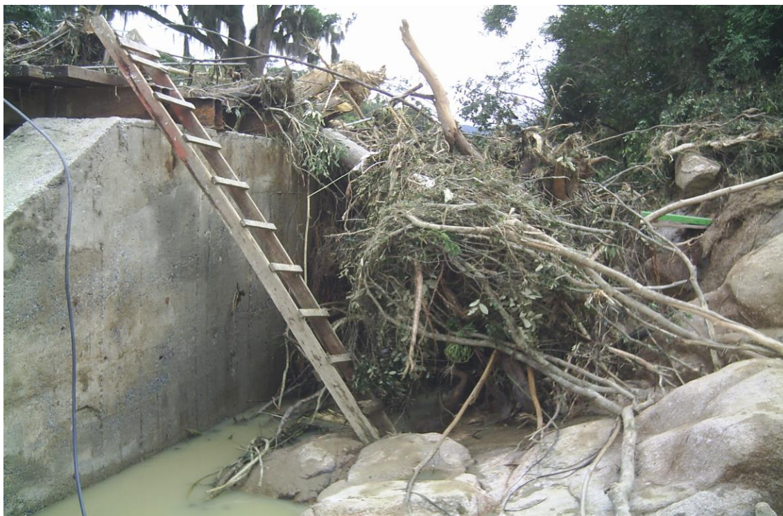
LOCALIDADE PICADAS – CABECEIRA DA PONTE ATINGIDA