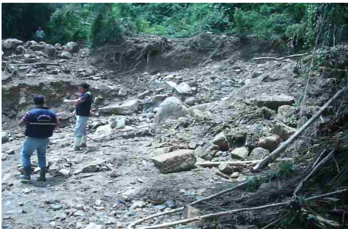
LOCALIDADE RIO DAS FURNAS - DESLIZAMENTO