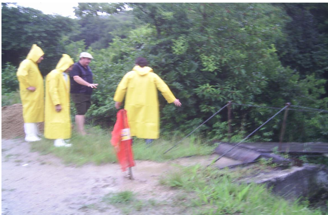
LOCALIDADE PICADAS – PONTE DE PEDESTRES ATINGIDA POR DESLOCAMENTO DE PEDRA BASE