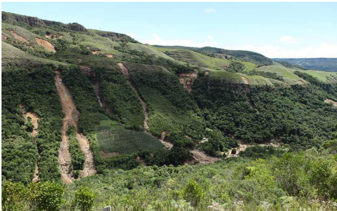
LOCALIDADE RIO DAS FURNAS – PONTOS DE DESLIZAMENTO DE TERRAS