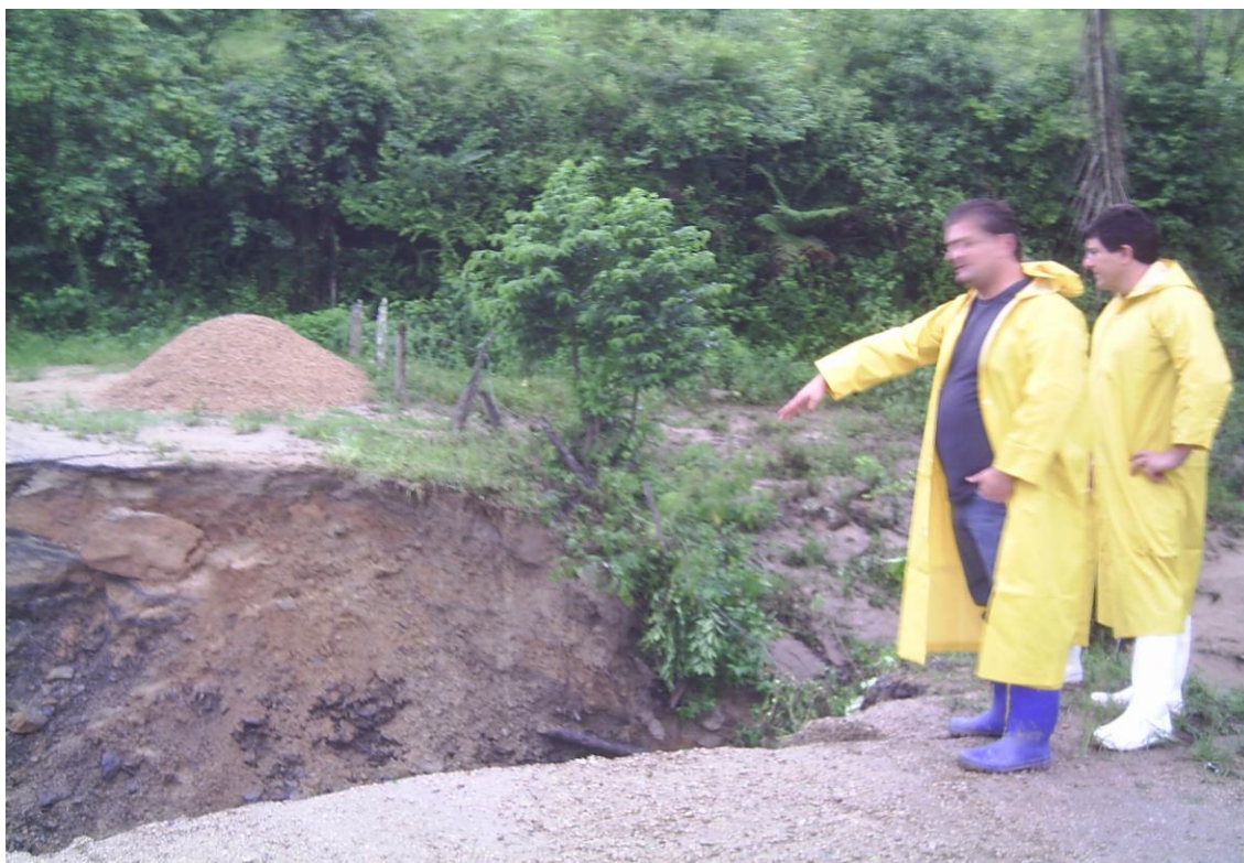
LOCALIDADE PICADAS – BUEIRO ARREBENTADO – ESTRADA INTRANSITÁVEL