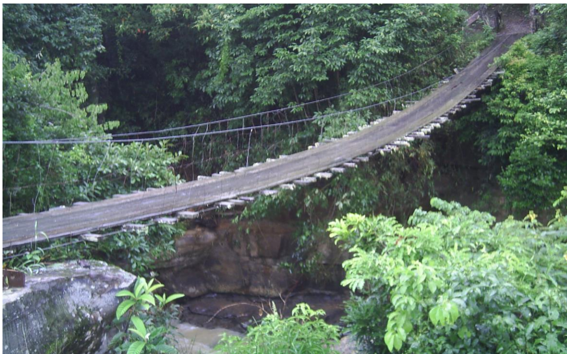
LOCALIDADE PICADAS – PONTE DE PEDESTRES ATINGIDA POR DESLOCAMENTO DE PEDRA BASE