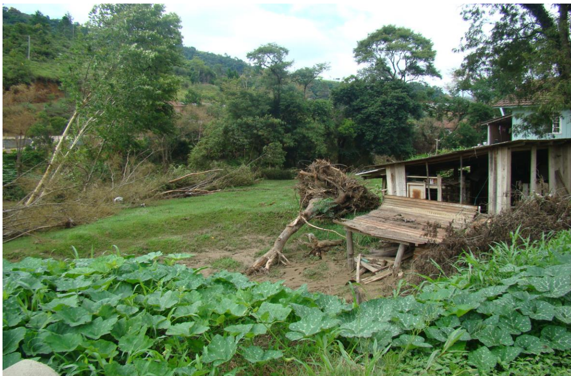
LOCALIDADE BARRAÇÃO DE DENTRO – CASA ATINGIDA PELAS ÁGUAS