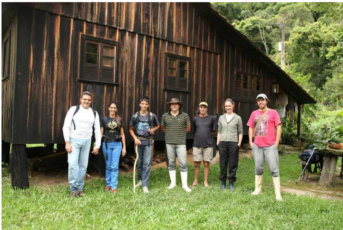
LOCALIDADE RIO DAS FURNAS – RESERVA RIO DAS FURNAS