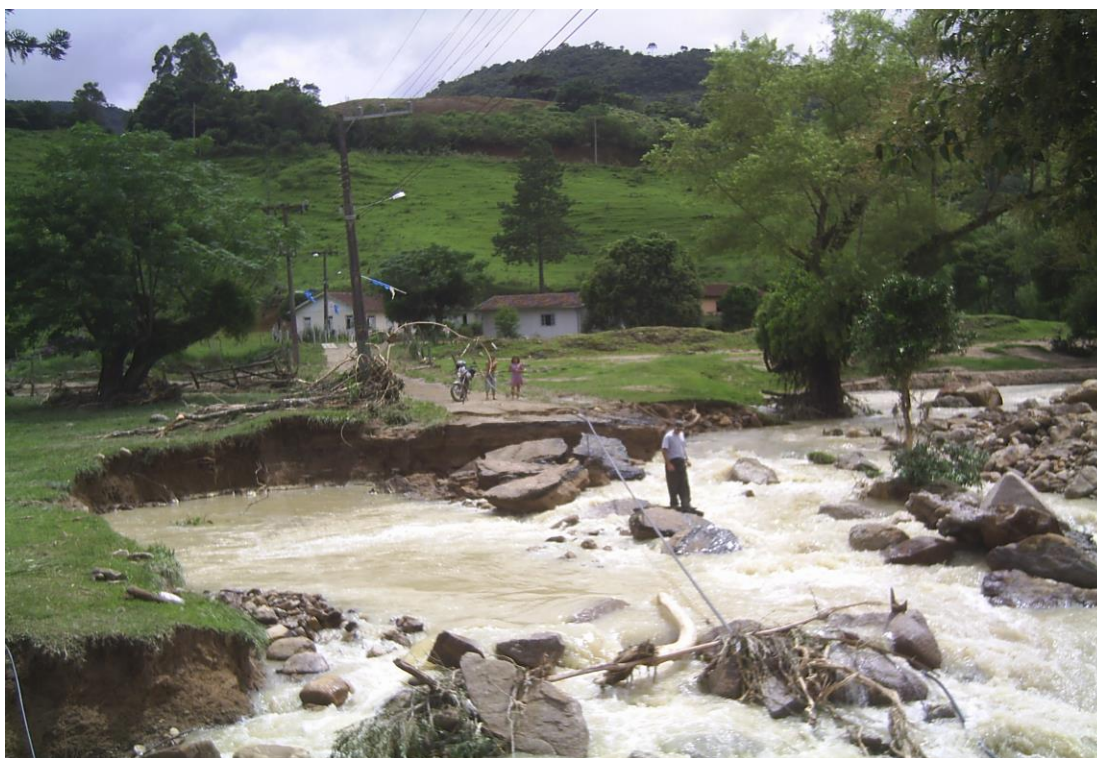
LOCALIDADE – S. LEONARDO – LOCAL ONDE EXISTIA PONTE