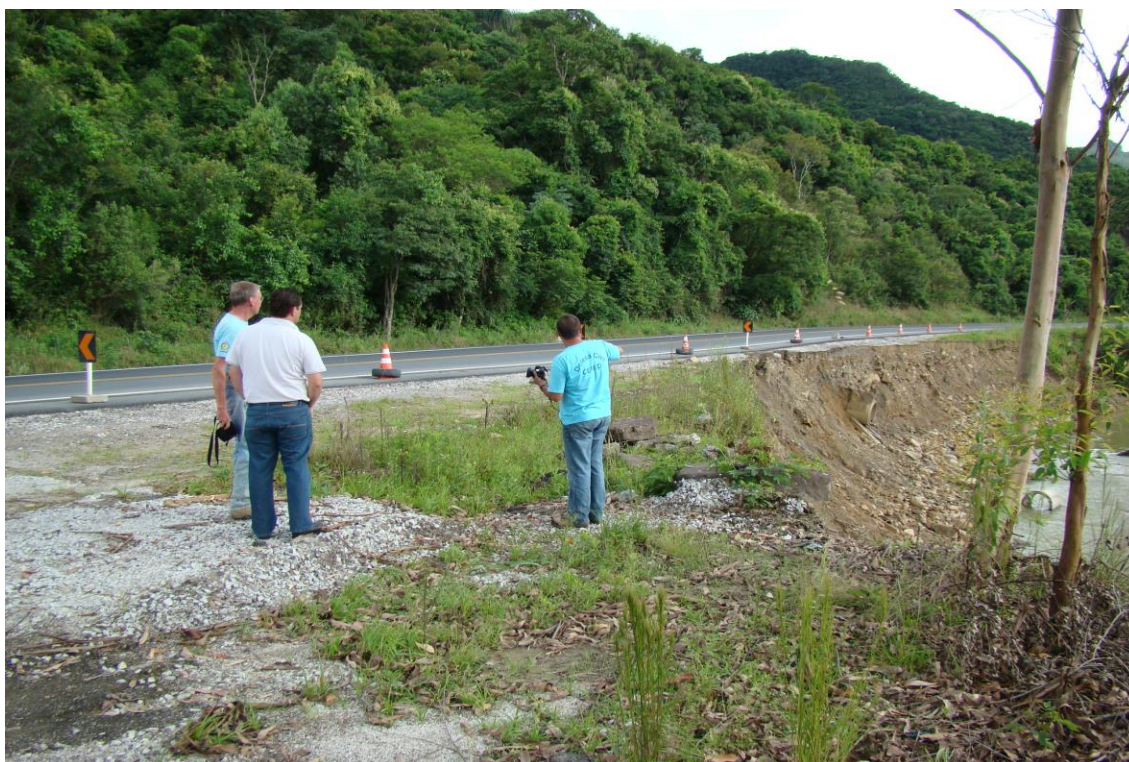
LOCALIDADE PICADAS BR 282 – GEOLOGOS ANALISANDO DESLIZAMENTO