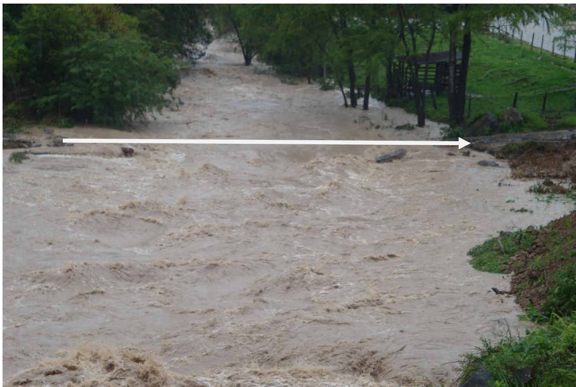
LOCALIDADE – ÁGUAS FRIAS – LOCAL ONDE EXISTIA PONTE