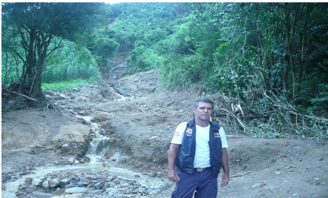
Localidade Rio das Furnas – Trajetória do deslizamento de terra