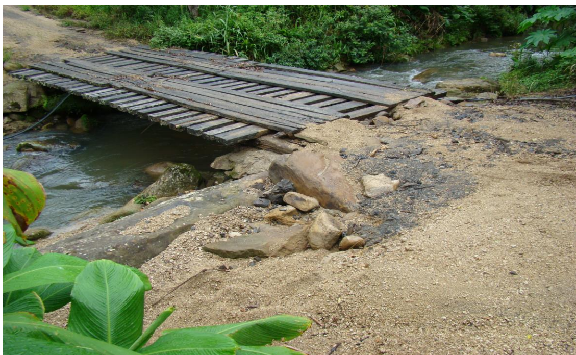
LOCALIDADE PICADAS – Entrada a esquerda do bar Cruzeiro - CABECEIRA DA PONTE PARCIALMENTE DESTRUÍDA