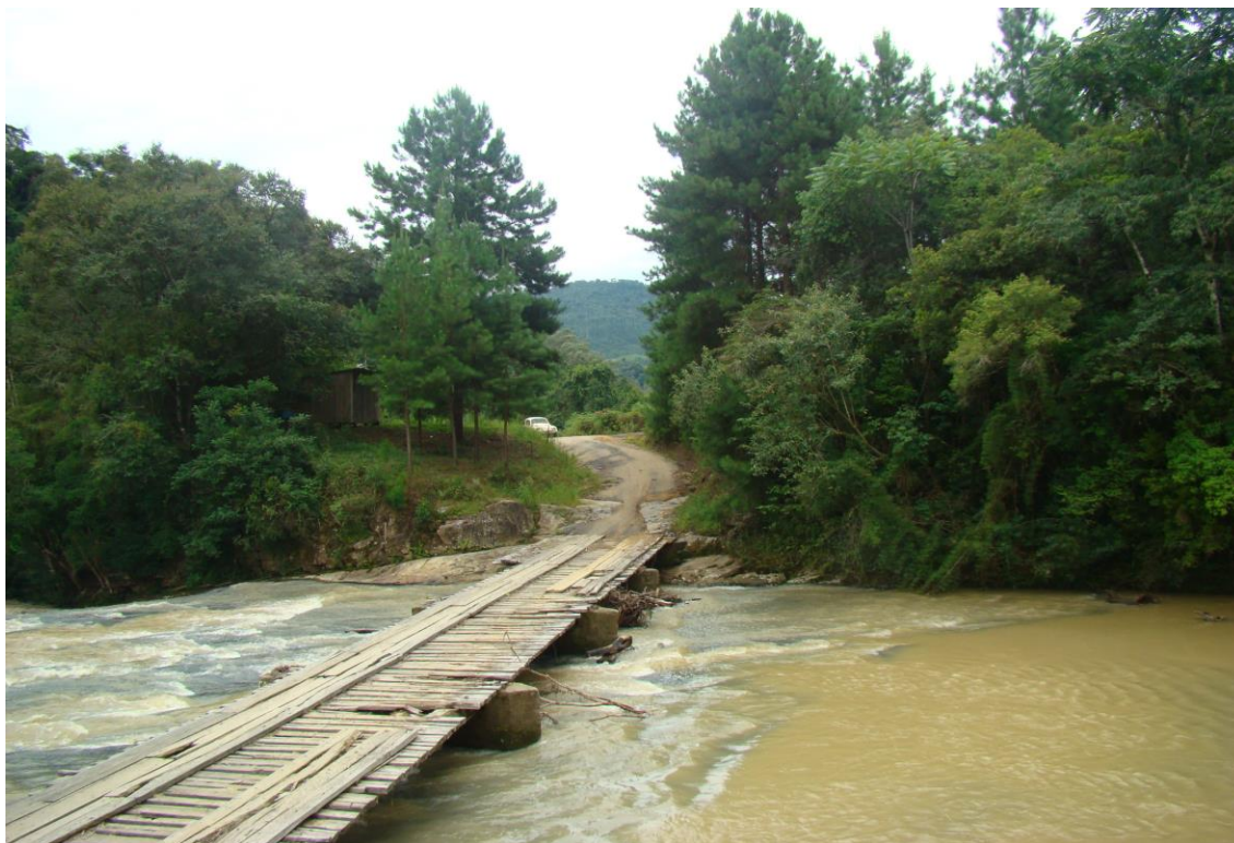
LOCALIDADE BARRO BRANCO – DIVISA BOM RETIRO – PONTE DANIFICADA