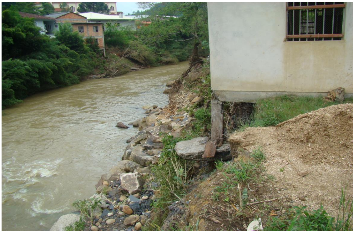
LOCALIDADE BARRAÇÃO DE DENTRO – AÇOUGUE EM RISCO