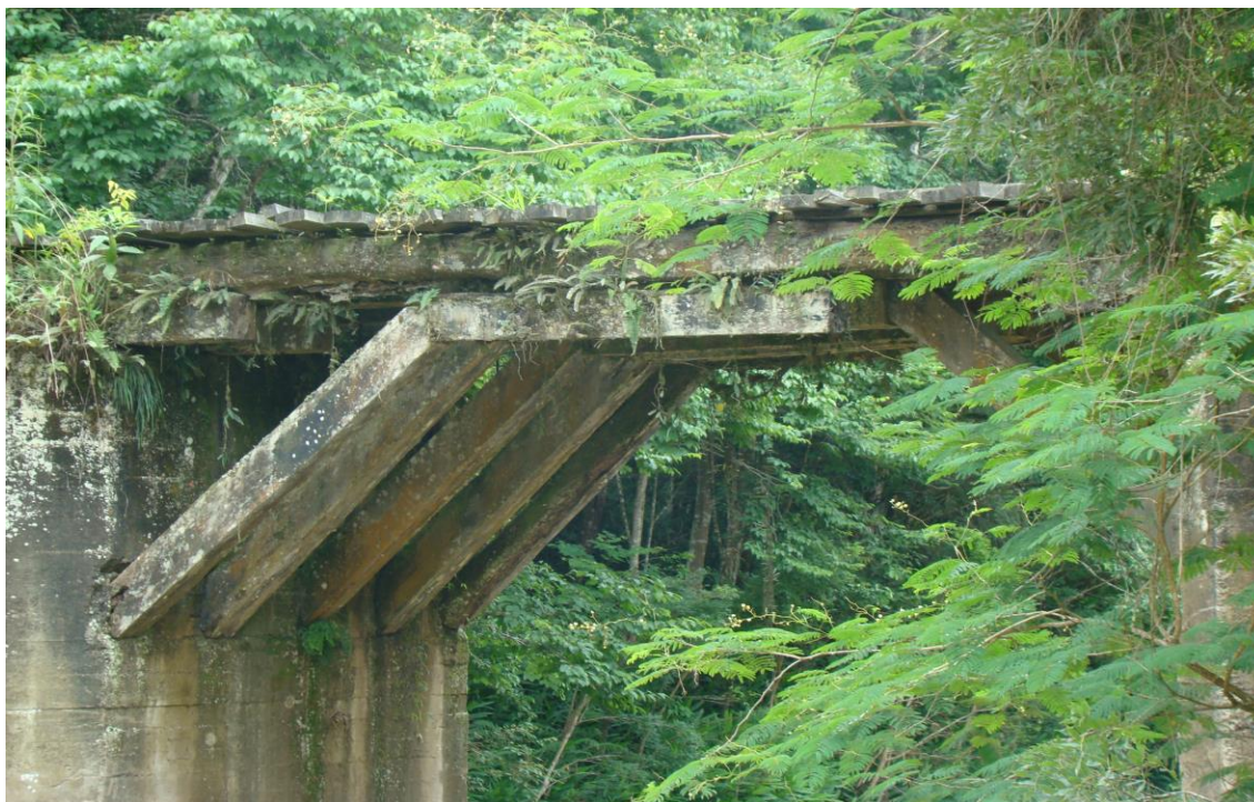
LOCALIDADE BARRO BRANCO DIVISA COM CHAPADÃO DO LAGEADO PONTE ATINGIDA EM RISCO (ARRANCOU 03 TRÊS MÃOS FRANCESAS)