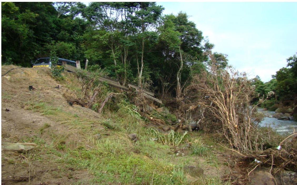
LOCALIDADE RIO LESSA – PONTE DE PEDESTRES ARRANCADA – (outro ângulo)