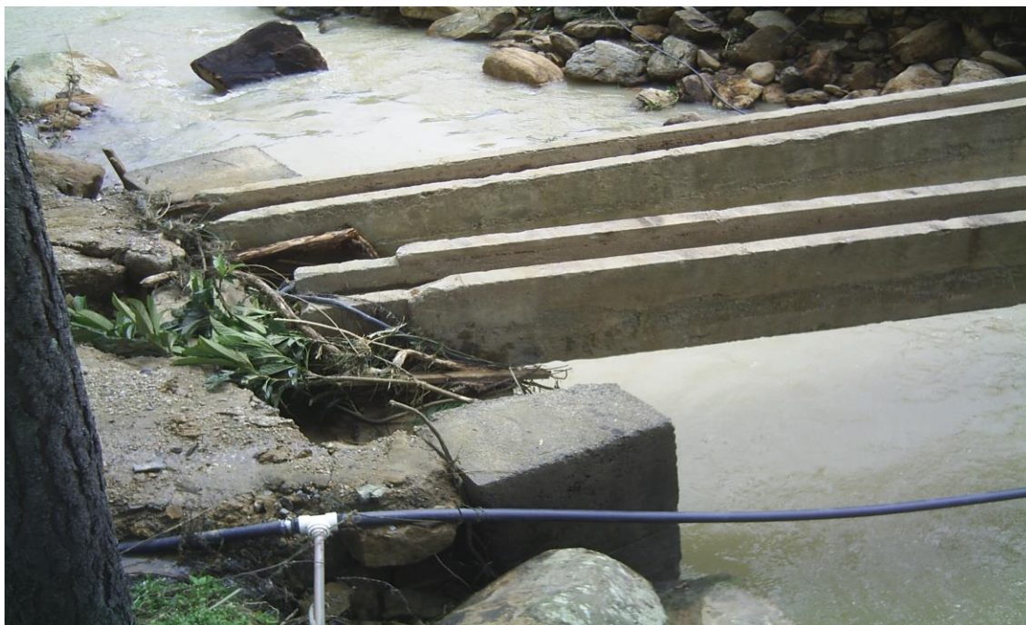
LOCALIDADE S. LEONARDO - PONTE PARCIALMENTE DANIFICADA