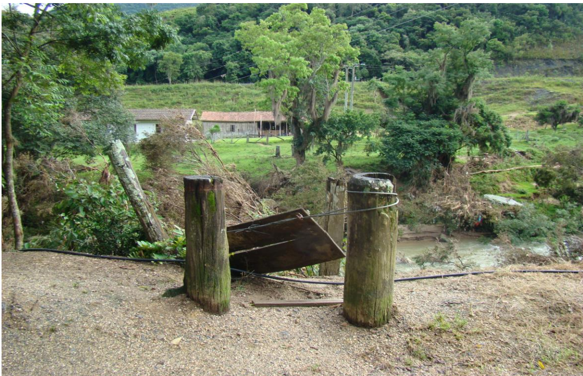
LOCALIDADE RIO LESSA – PONTE DE PEDESTRES ARRANCADA