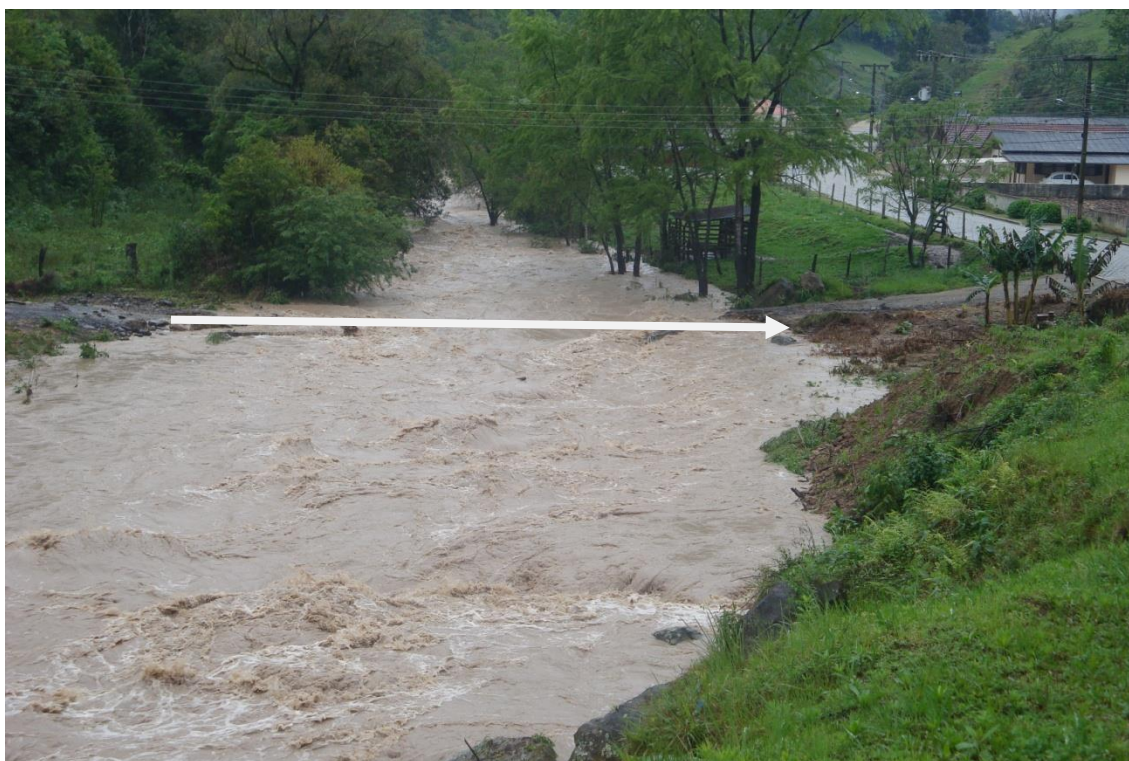
LOCALIDADE – ÁGUAS FRIAS – LOCAL ONDE EXISTIA PONTE