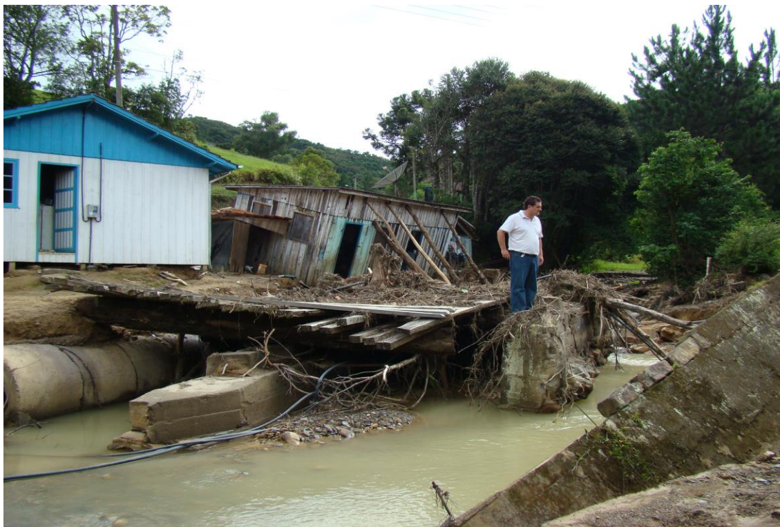
LOCALIDADE S. LEONARDO – LOCAL ONDE EXISTIA PONTE