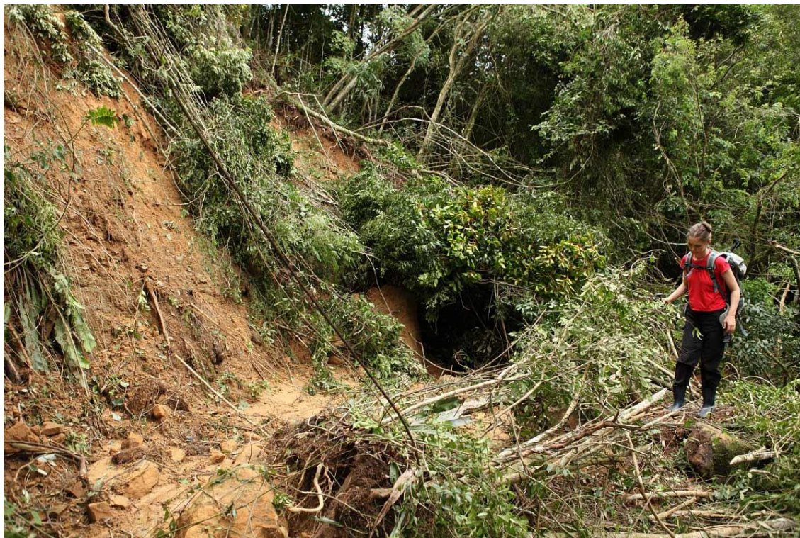
LOCALIDADE RIO DAS FURNAS – DESLIZAMENTO DE TERRA