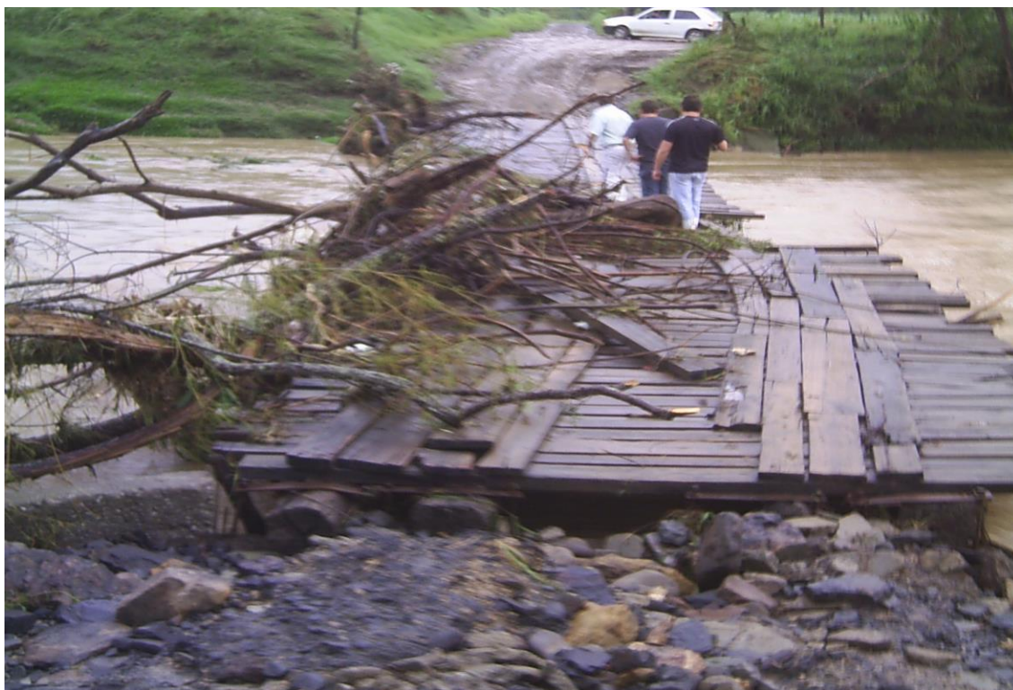
LOCALIDADE S. WENDOLINO – PONTE DANIFICADA