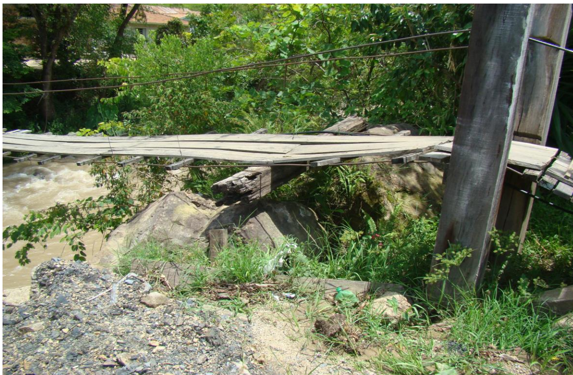
LOCALIDADE ÁGUAS FRIAS – PONTE DE PEDESTRES DANIFICADA POR DESLOCAMENTO DAS PEDRAS