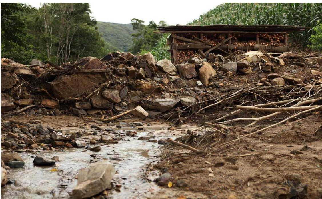
Localidade Rio das Furnas – Paiol com colheita de cebola e parte do desmoronamento