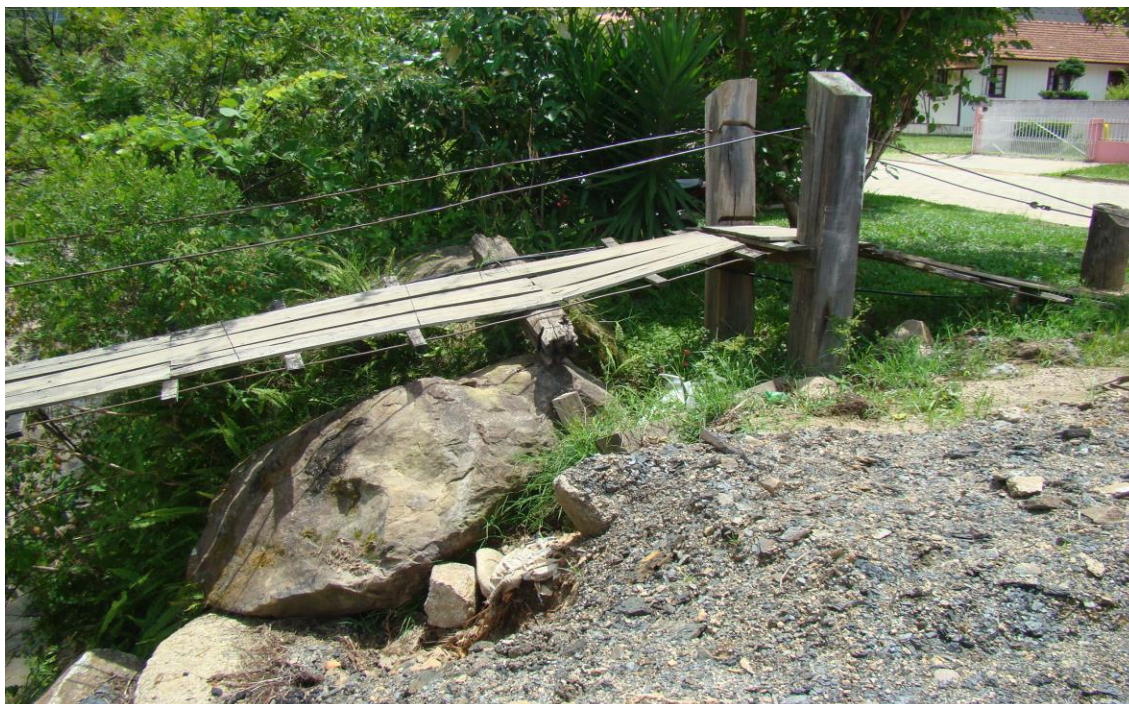
LOCALIDADE ÁGUAS FRIAS – PONTE DE PEDESTRES DANIFICADA POR DESLOCAMENTO DAS PEDRAS