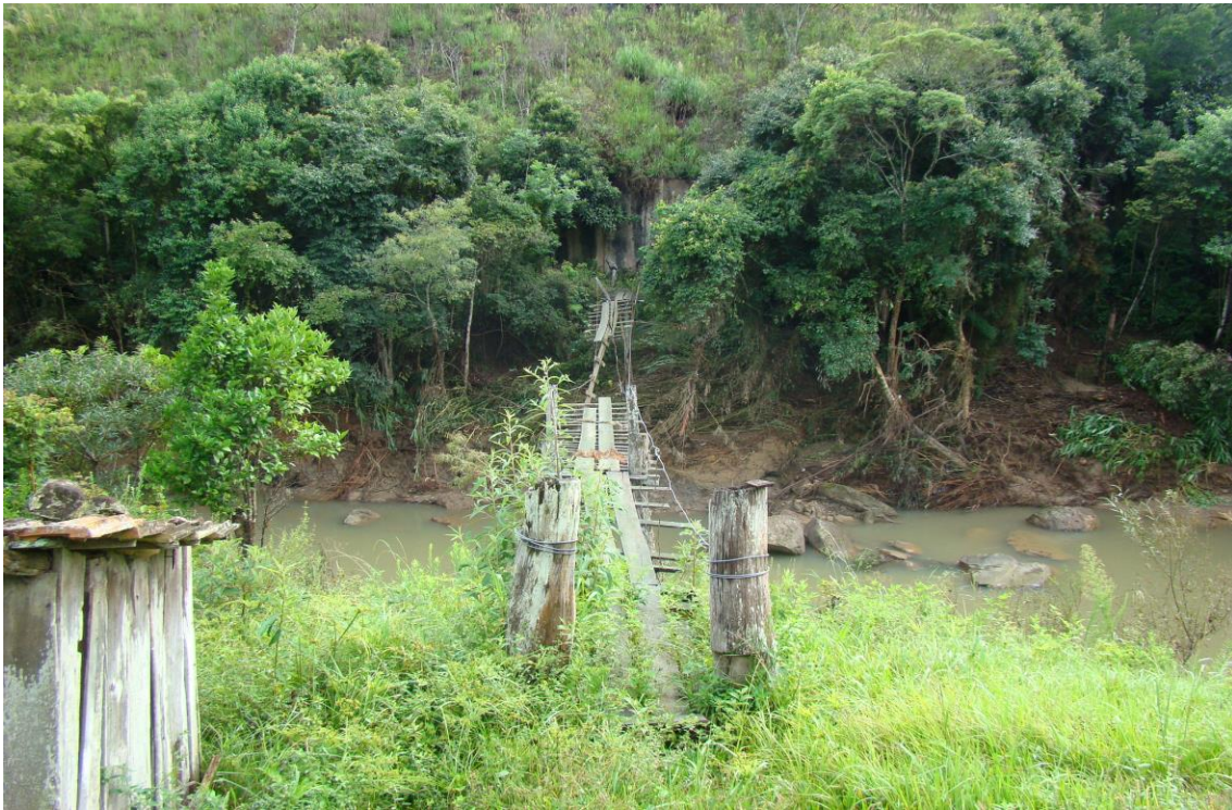
LOCALIDADE RIO LESSA – PONTE DE PEDESTRES DESTRUIDA (outro ângulo)