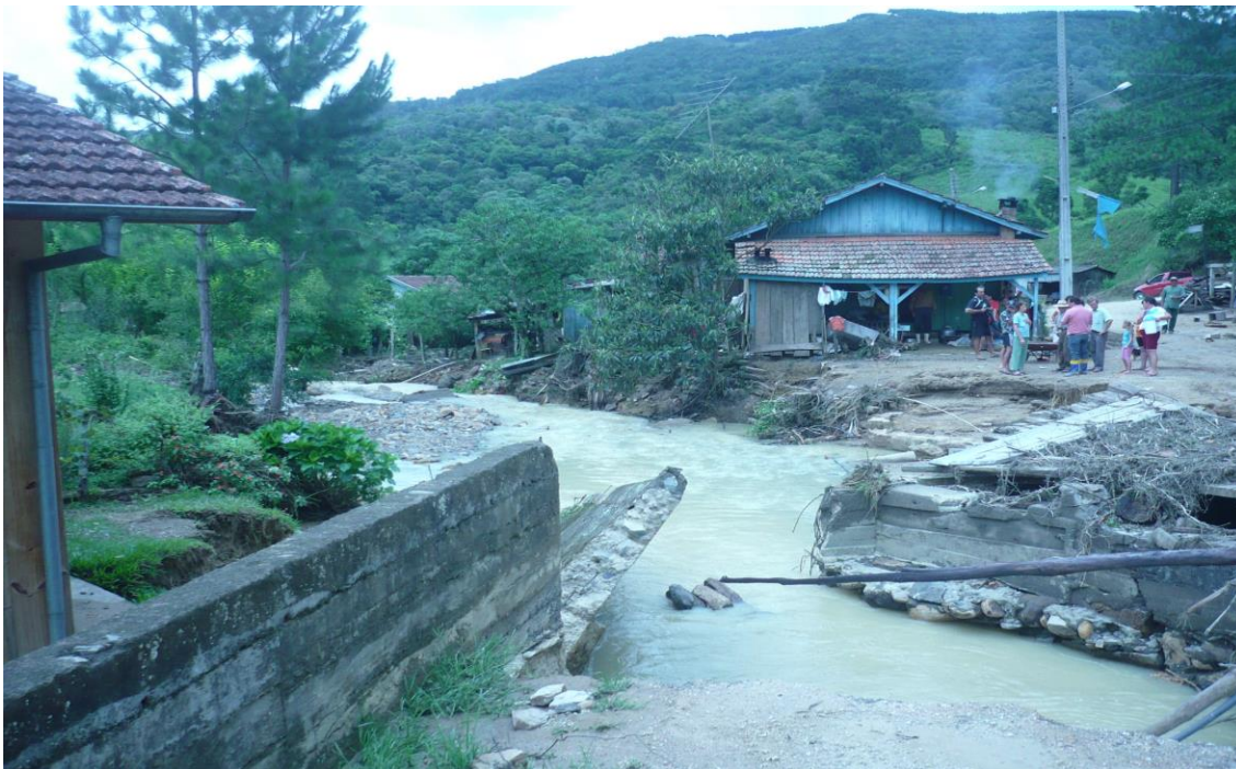
LOCALIDADE S. LEONARDO – PONTE ARRANCADA E CASAS ATINGIDAS