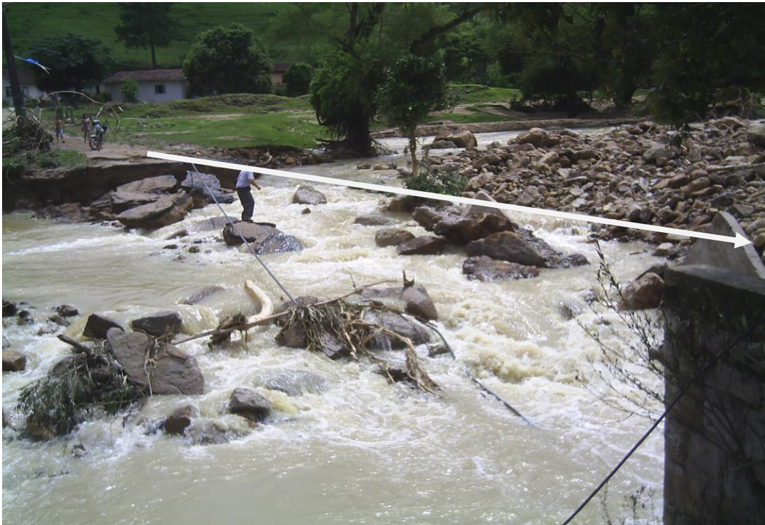
LOCALIDADE S. LEONARDO – LOCAL ONDE EXISTIA PONTE