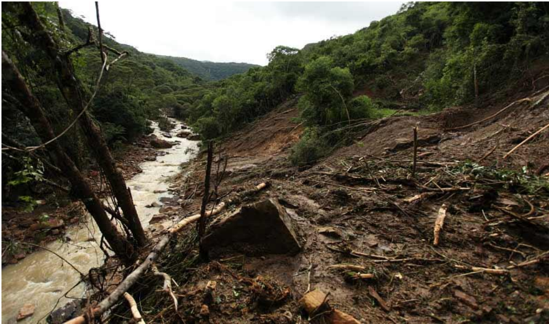
LOCALIDADE RIO DAS FURNAS - DESMORONAMENTO