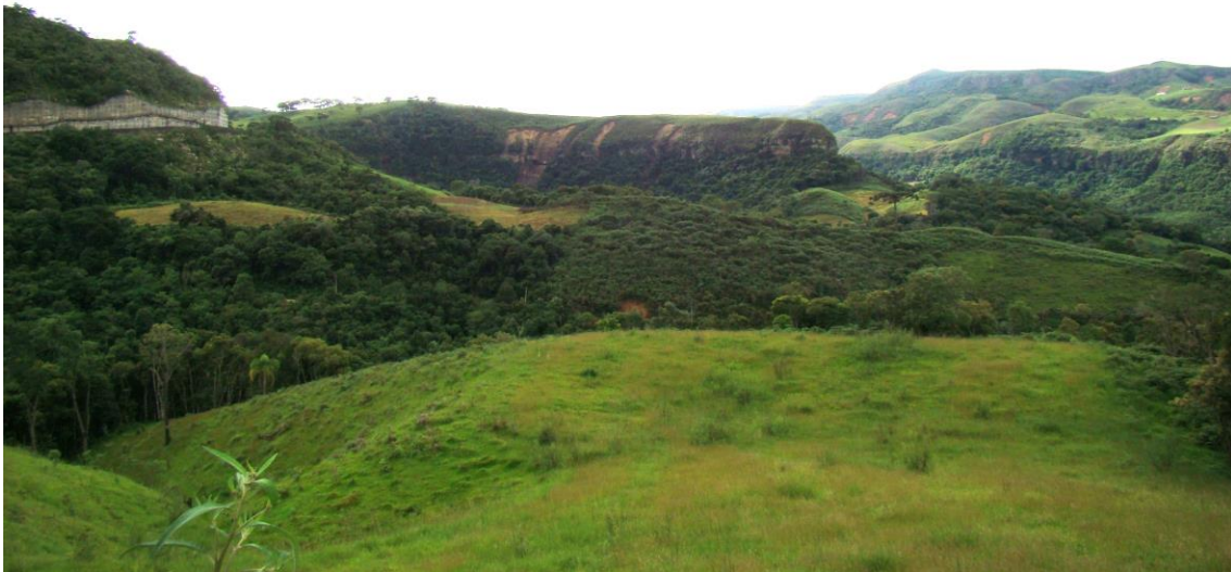
Localidade Quebra-dentes – vista geral dos pontos de deslizamento de terra