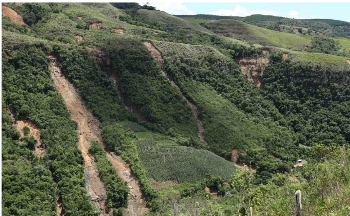
LOCALIDADE RIO DAS FURNAS – DETALHE DOS DESLIZAMENTOS