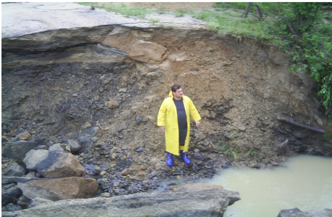
LOCALIDADE PICADAS – BUEIRO ARREBENTADO