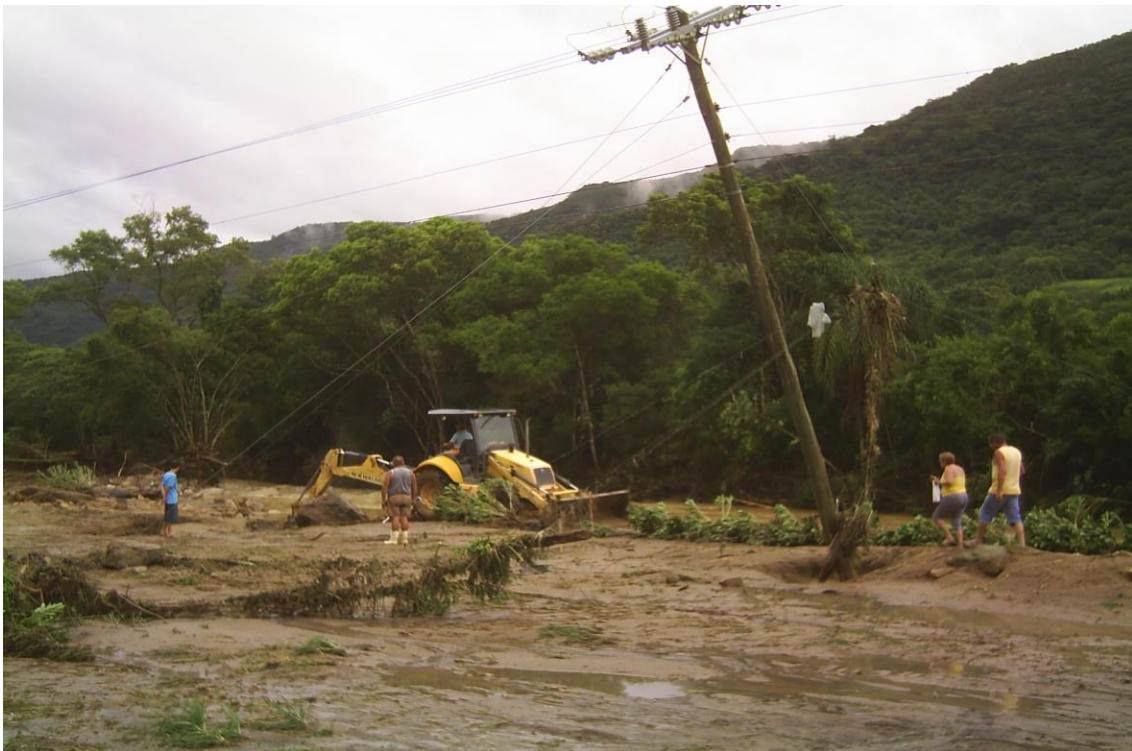
LOCALIDADE PICADAS – ESTRADA MUNICIPAL DESTRUIDA E POSTES ARRANCADOS