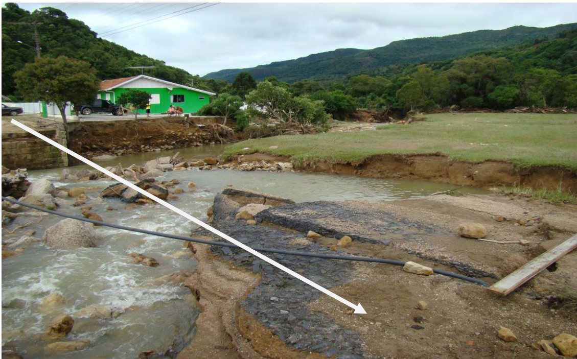
LOCALIDADE S. LEONARDO – ONDE EXISTIA PONTE