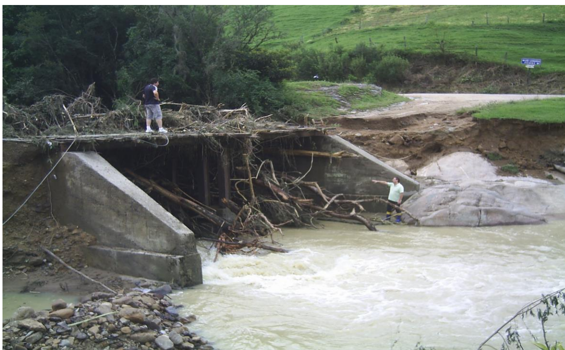
LOCALIDADE PICADAS – PONTE ATINGIDA