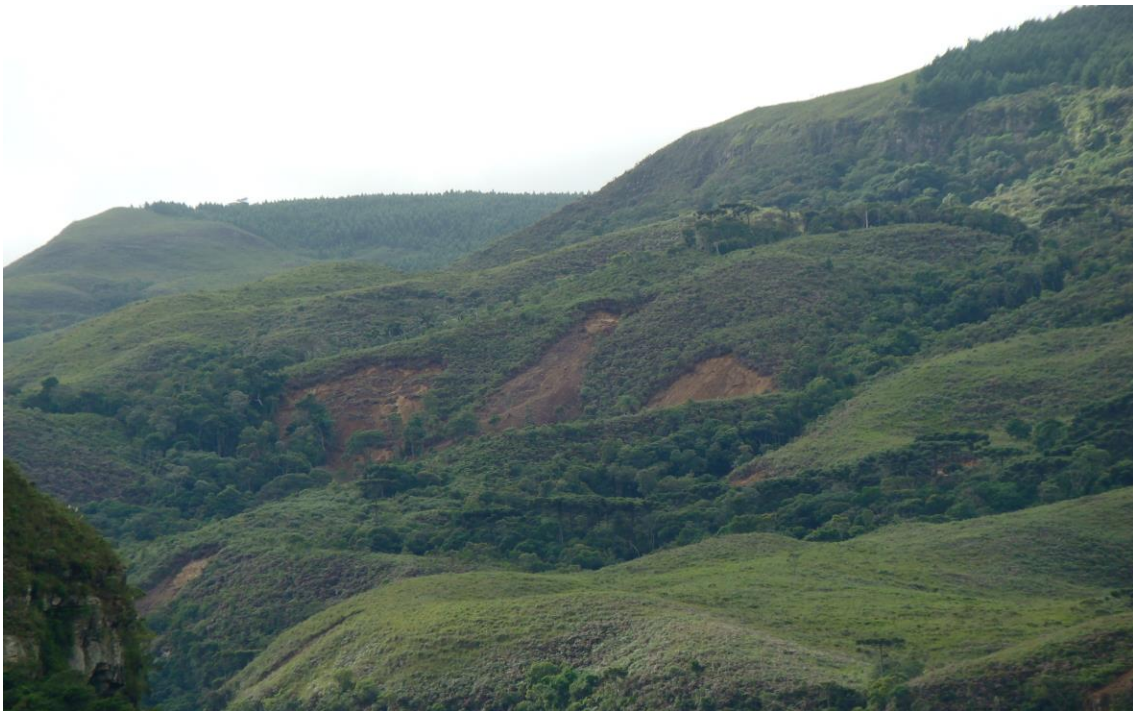
Localidade Furnas em S. Leonardo – detalhes dos deslizamentos