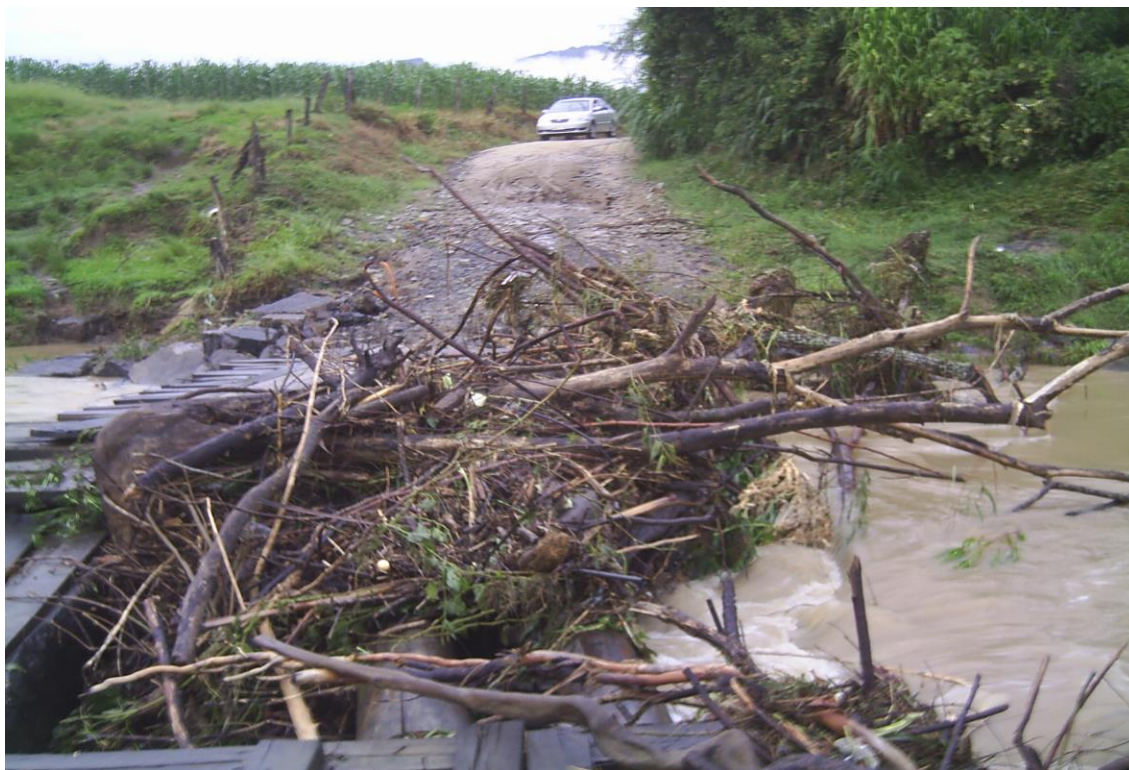
LOCALIDADE S. WENDOLINO – DETALHE PONTE DESTRUIDA