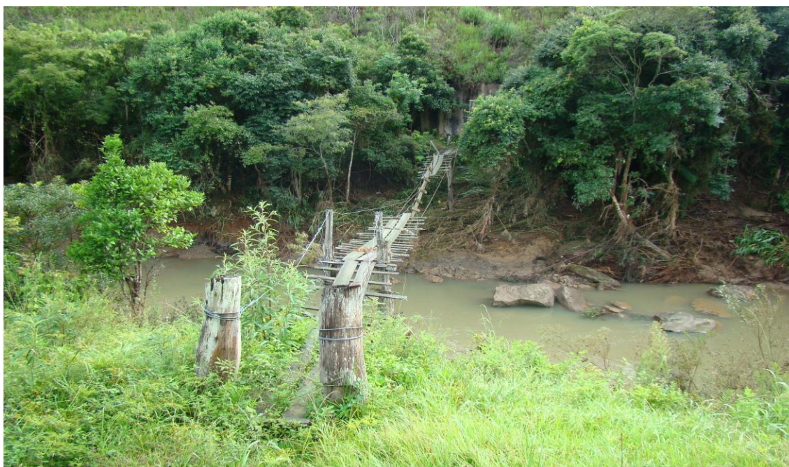
LOCALIDADE RIO LESSA – PONTE DE PEDESTRES DESTRUÍDA