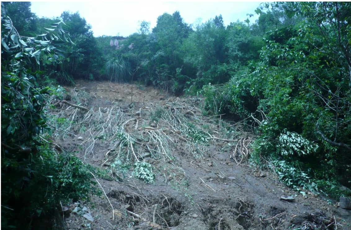
LOCALIDADE RIO DAS FURNAS - DESLIZAMENTO