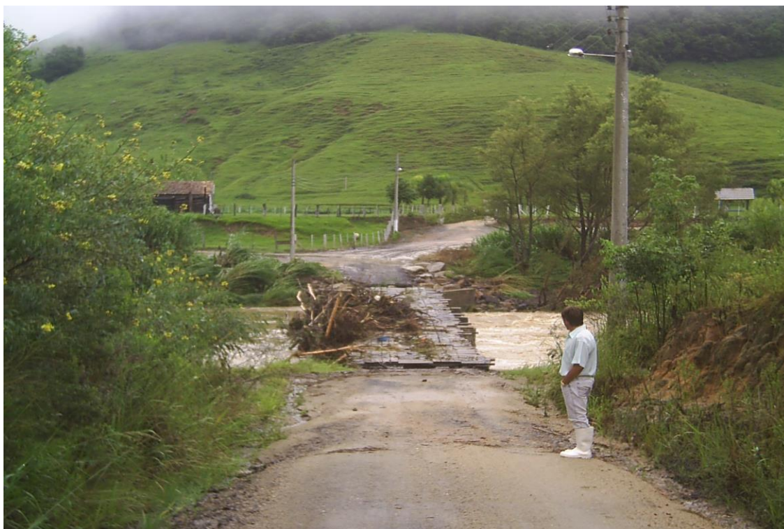
LOCALIDADE RIOZINHO – CABECEIRA DA PONTE DANIFICADA