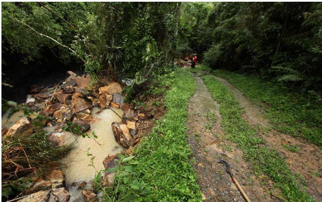
LOCALIDADE RIO DAS FURNAS - DESMORONAMENTO