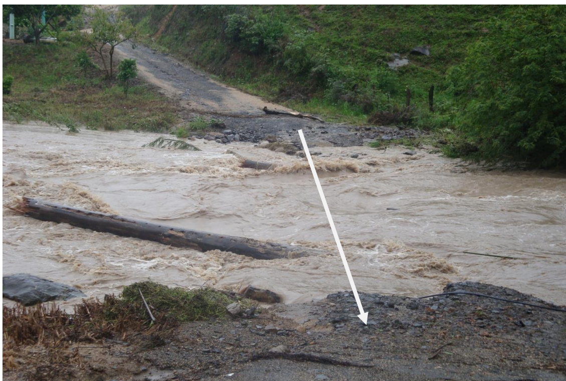
LOCALIDADE – ÁGUAS FRIAS – LOCAL ONDE EXISTIA PONTE – MORADORES ISOLADOS