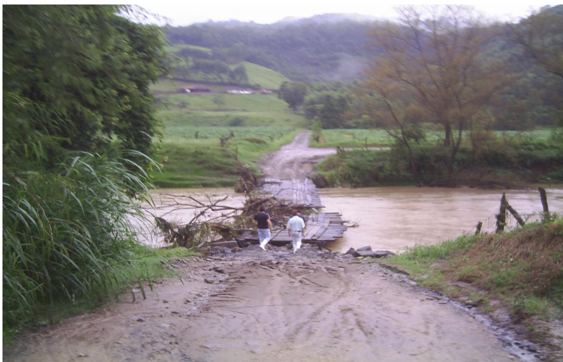
LOCALIDADE S. WENDOLINO – CABECEIRA DA PONTE DANIFICADA E ESTRUTURA COMPROMETIDA E INTRANSITÁVEL