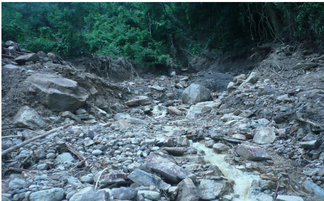
Localidade Rio das Furnas - Deslizamento