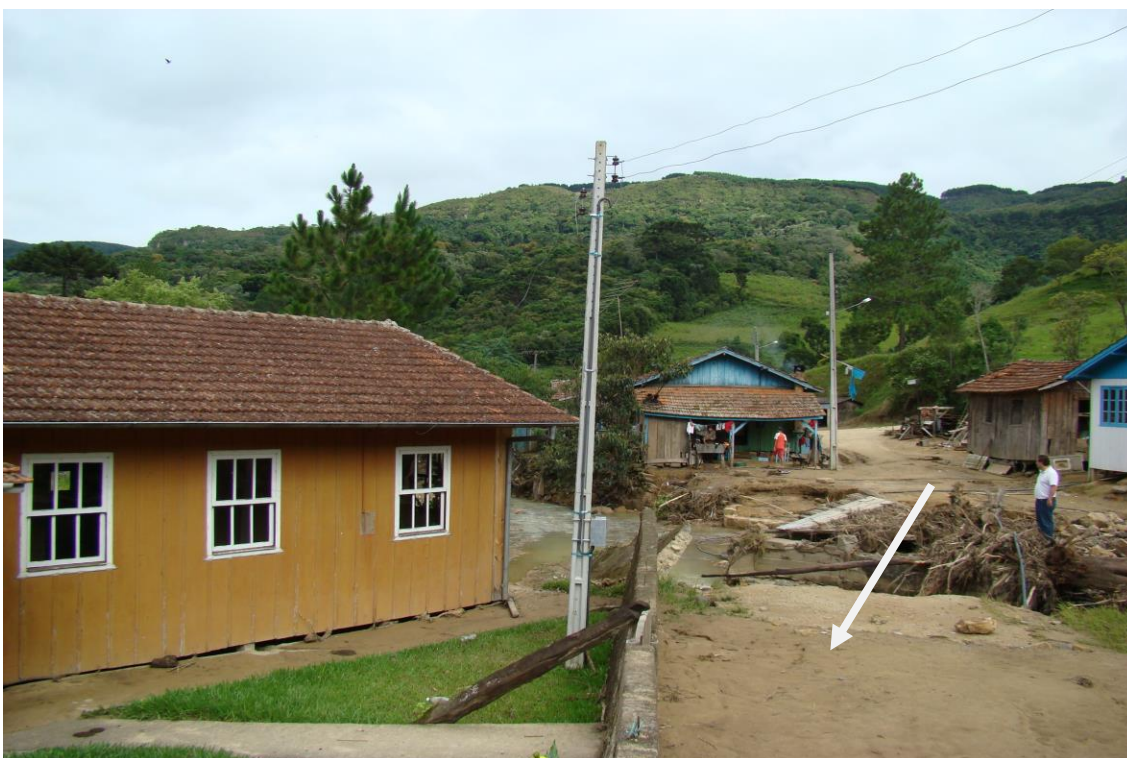
LOCALIDADE S. LEONARDO – UMA DAS PONTES DESTRUIDA E CASAS ATINGIDAS