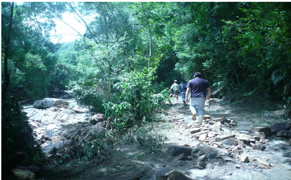
LOCALIDADE RIO DAS FURNAS – DESLIZAMENTO