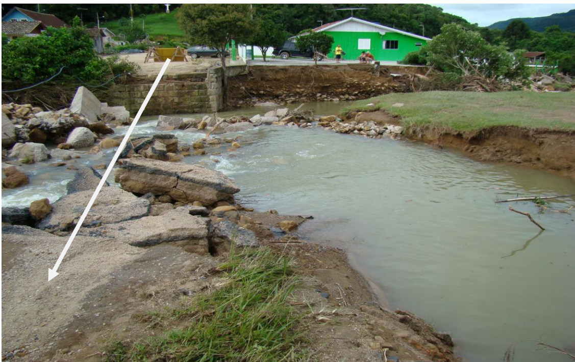
LOCALIDADE S. LEONARDO – ONDE EXISTIA PONTE