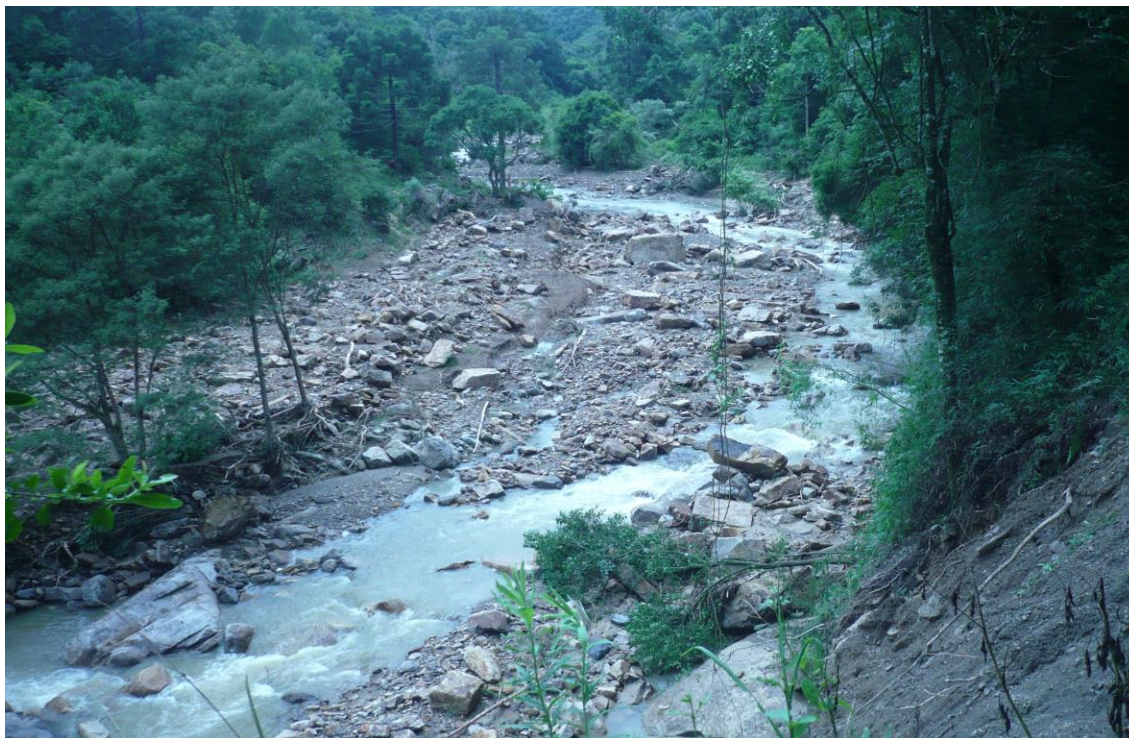
LOCALIDADE S. LEONARDO – DESLIZAMENTO SEGUINDO O LEITO DO RIO