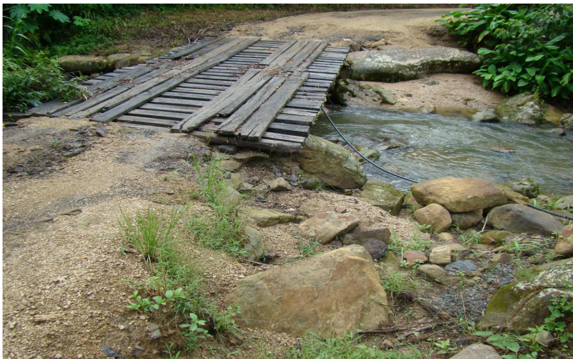
LOCALIDADE PICADAS – Entrada a esquerda do bar Cruzeiro - CABECEIRA DA PONTE PARCIALMENTE DESTRUIDA