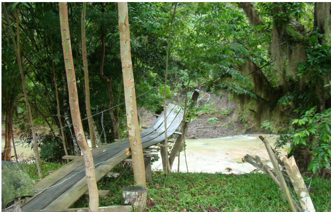
LOCALIDADE PICADAS – PONTE DE PEDESTRES DESTRUÍDA