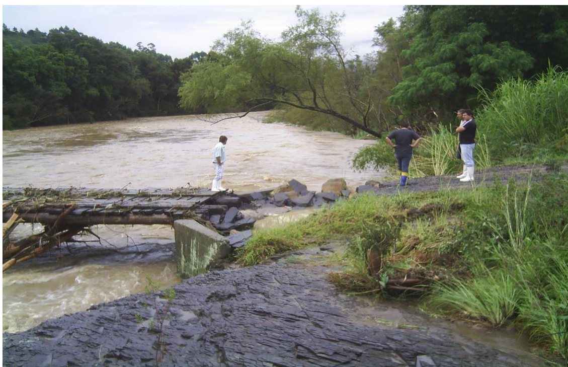
LOCALIDADE RIOZINHO – PONTE PARA RIOZINHO E PINGUIRITO