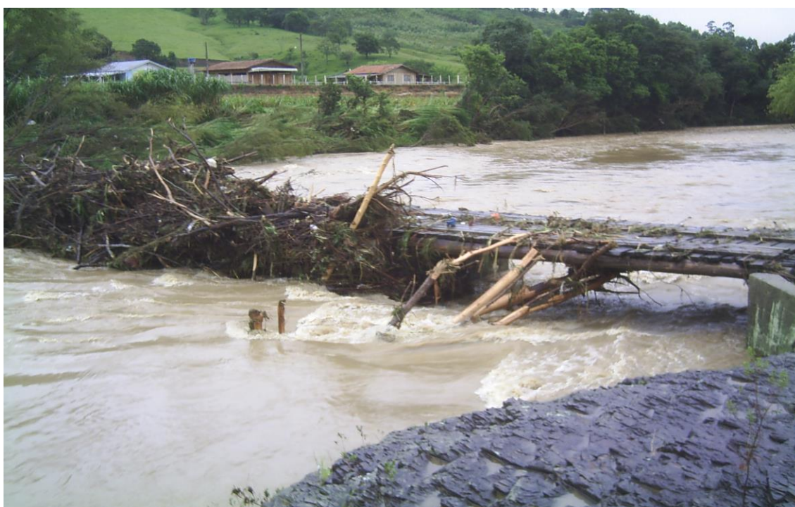
LOCALIDADE RIOZINHO – PONTE ACESSO O RIOZINHO E PINGUIRITO