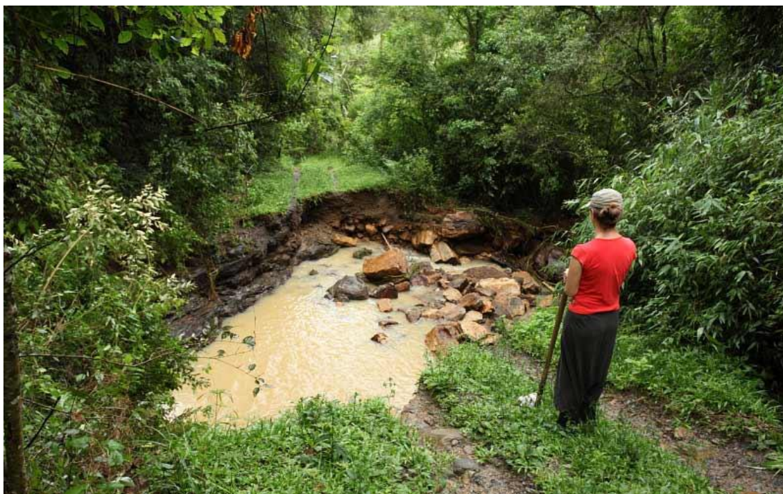
LOCALIDADE RIO DAS FURNAS – DESMORONAMENTO