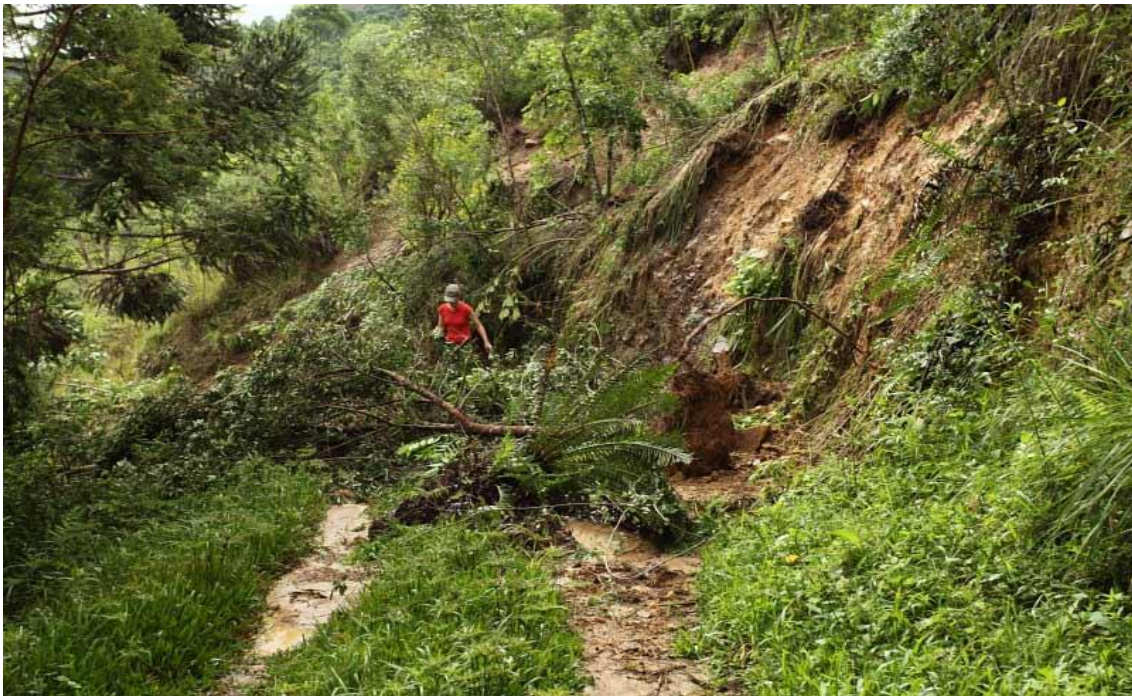
LOCALIDADE RIO DAS FURNAS - DESMORONAMENTO